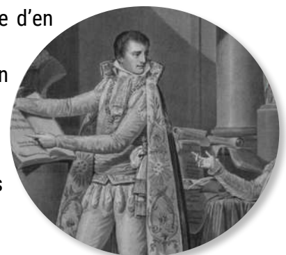
Code Napoléon. Sa Majesté l'Empereur et Roi montre à l'Impératrice-Reine les articles du Code civil, estampe de David, 1804

Première distribution des décorations de la Légion d'honneur, le 15 juillet 1804.