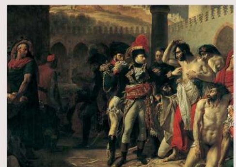
BONAPARTE VISITANT LES PESTIFÉRÉS DE JAFFA, 11 MARS 1799.

A droite, un exemple de zoom sur une œuvre :